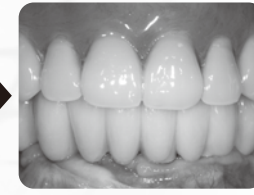
セラミックの上部構造装着