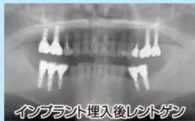
インプラント埋入後レントゲン