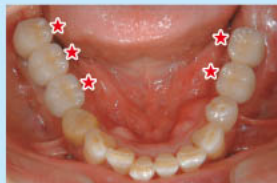
インプラント埋入後 (★印の歯がインプラント)