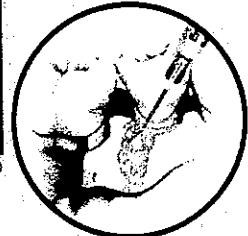
エムドゲイン®ゲルの塗布